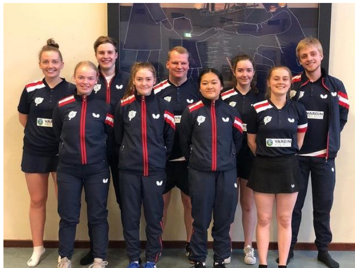
TBF-leikarar avmyndaðir í nýggjum leikbúnum

Seinastu 1/4 øld hava gentur og kvinnur av Tvøroyri rátt fyri borgum í kvinnudeildunum í borðtennis. TBF hevur síðani 1997 vunnið 12 meistaraheiti í einmansleiki hjá kvinnum. Dreingirnir hava tó eisini verið stinnir.