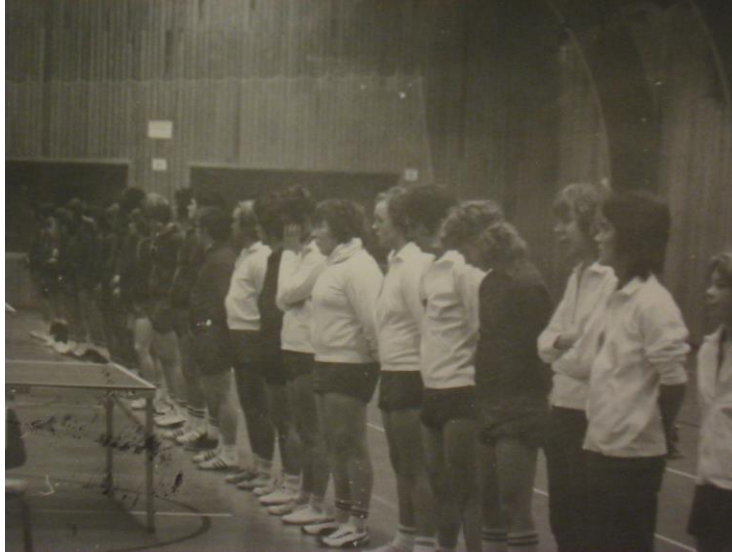
Landsdystur í millum Føroyar og Ísland í 1973

Og Føroyar vunnu. Hetta var fyrsti A landsdystur í nakrari ítróttagrein, at Føroyar vunnu á íslendingum. Føroyar høvdu vunnið áður á íslendingum, men bara í B landsdysti.