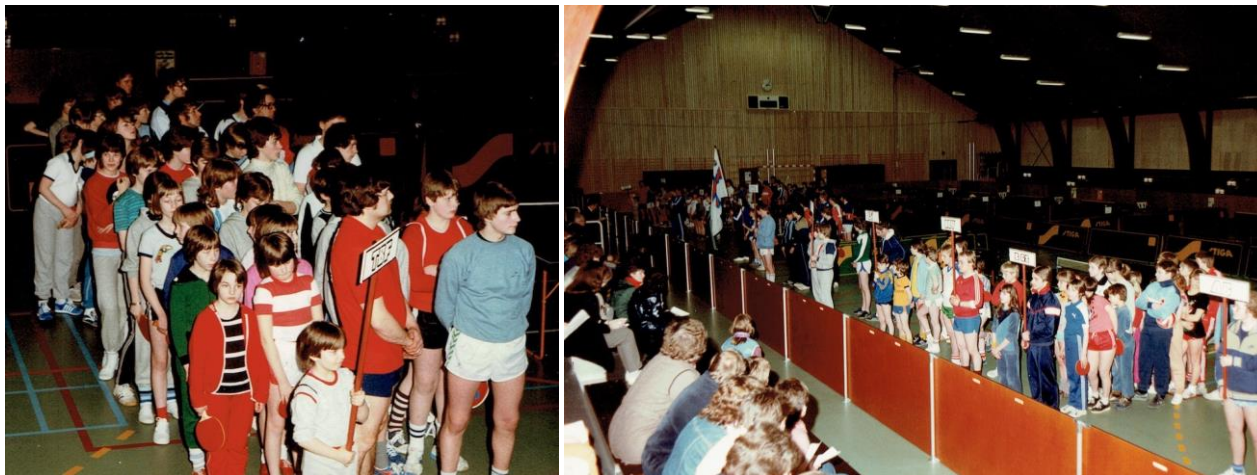
TBF hátíðarheldur 35-ára føðingardagin í 1983. Tá varð skipað fyri stórari kapping í nýggju ítróttarhøllini í Trongisvági

Eftir at virkseimið hjá TBF flutti inn í stásiligu høllina í Trongisvági í 1982, blivu umstøðurnar at spæla borðtennis fullkomnar og í fjør hátíðarhelt felagið 40 ár við borðtennisspæli í skúla- og ítróttarhøllini í Trongisvági.